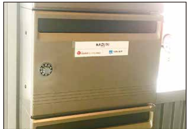
貴社専用の郵便受け