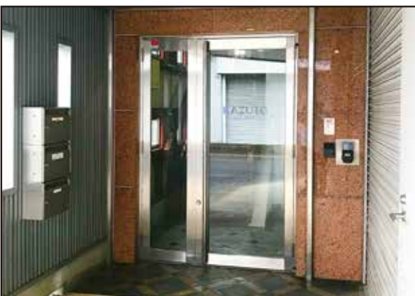
玄関エントランス