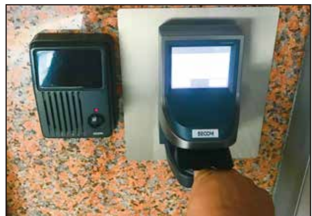
指紋認証で出入りできる