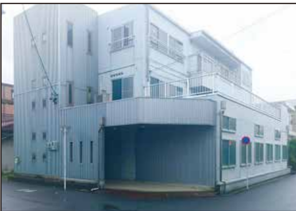
愛知県春日井市味美町3-86-1